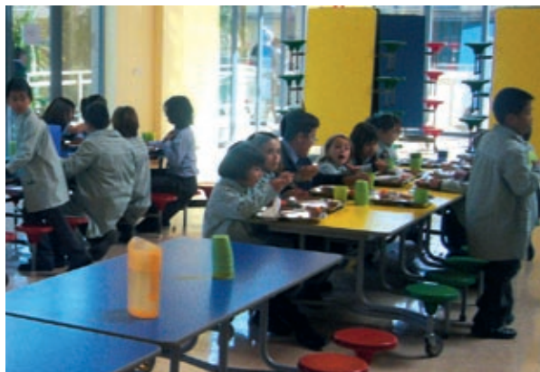
Un grupo de pequeños come en el flamante comedor del centro.

Hemos observado que los jóvenes menores de 14 años nos dicen que aunque no les gustan las verduras hacen un esfuerzo y con