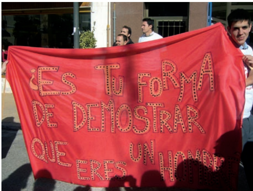
Una de las pancartas confeccionadas por los alumnos del Iale. E. GARCÍA/N. OROZCO

Tras este discurso se dio paso a la actuación del cantante y líder del grupo Revolver, Carlos Goñi, quien después nos ofreció unas palabras y dio paso a las redacciones escritas por los alumnos de cada colegio. La represen-