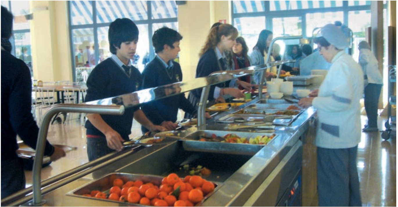
Varios alumnos pasan por el mostrador de comidas para recoger sus bandejas.