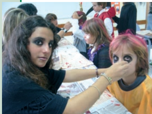
Los hermanos Sendra se acicalan. IALE

Y sí, pese a ser mayores y adolescentes, y tras todo nuestro esfuerzo, disfrutamos de la merienda como niños.