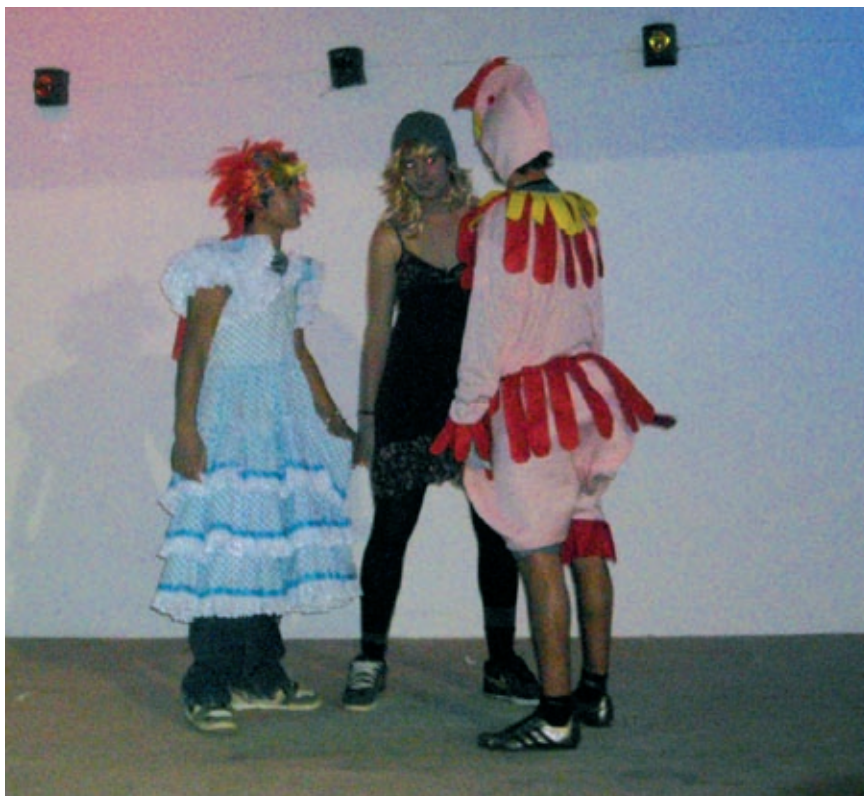
El trío en un momento de su representación en Calvestra. IALE