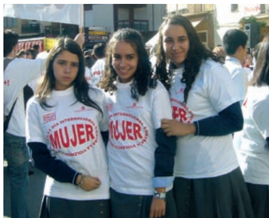
Las chicas de tercero de ESO en l'Eliana.