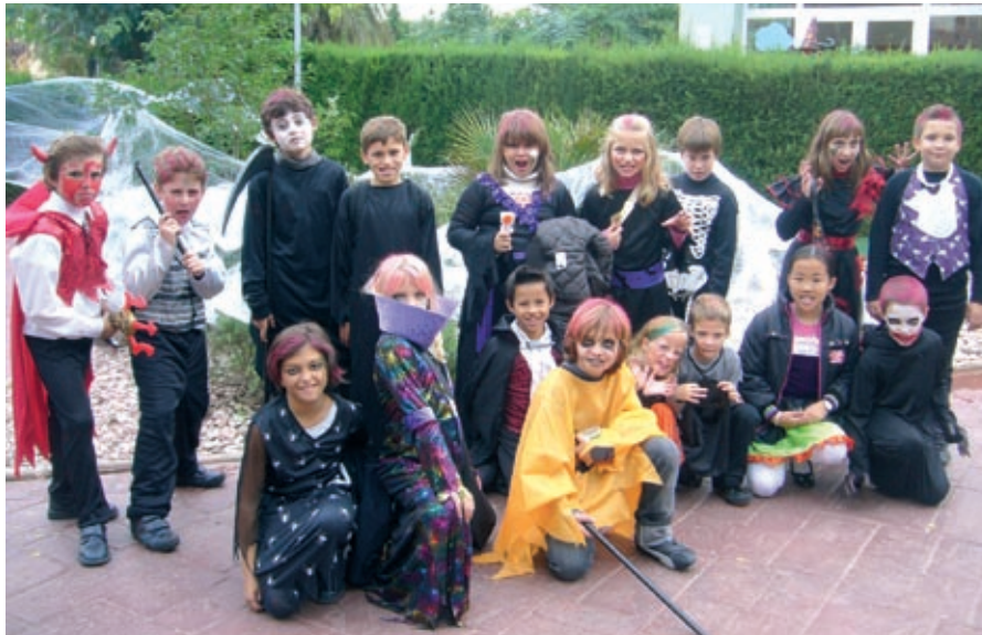
Un grupo de peques disfrazados momentos antes de comenzar la fiesta. IALE

Como empezó a llover, los talleres que iban a realizarse en el parque se tuvieron que trasladar a las clases de primaria. Allí, los alumnos de secundaria farraron las mesas de periódico y prepararon cada una de las manualidades: esqueletos hechos de trozos de papel, calabazas