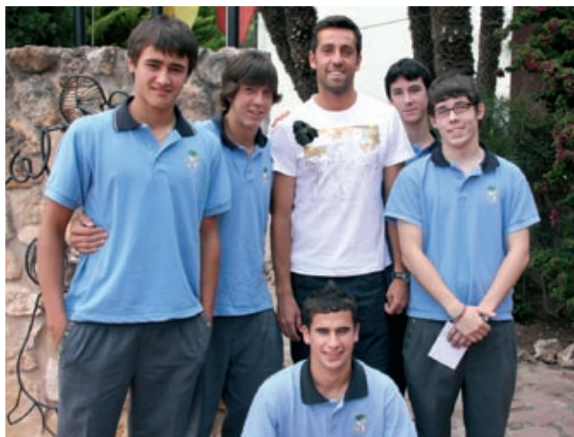
Edu con un grupo de fans del colegio. PATXI MACHADO

Es importante que haya clubes deportivos en el colegio.